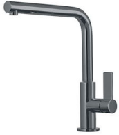
Mitigeur Omega Gun Metal 8497 856