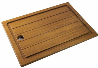
Planche de découpe en bois Iroko 8643 117