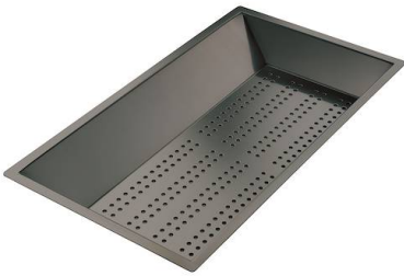
Cuvette perforée en acier inoxydable PVD Gun Metal 8151 006