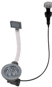
Vidange automatique Gun metal - PG 8407 110