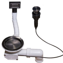
Vidange automatique Space Push Gun Metal - PO 8407 120